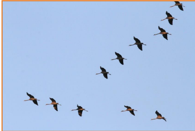
Kraniche und Großtrappen in großen Zahlen