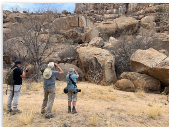
View on Rockrunner

Zum Abschluss führte ich die Gruppe zum Vogelparadies, wo tausende Flamingos vor der wunderschönen Dünen-Kulisse zu sehen waren – sagen wir einfach, sie waren begeistert. Urs entdeckte eine African Gallinule im Schilf und erzählte mir von einer beeindruckenden Beobachtung eines Baird's Sandpipers. Wir beobachteten noch die Teichrohrsänger und machten uns dann auf den Heimweg.