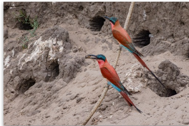
Southern Carmine Bee-eater