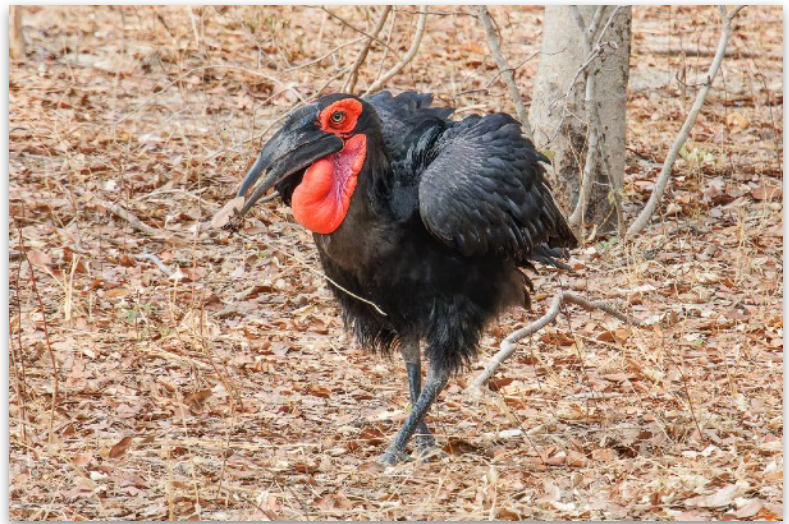
Southern Ground Hornbill

Die Fahrt nach Vic Falls verlief reibungslos. Wir hatten einen zuverlässigen Kontakt an der Grenze, der gegen eine „Gebühr“ schnell die notwendigen Visa beschaffte und sich auch um die