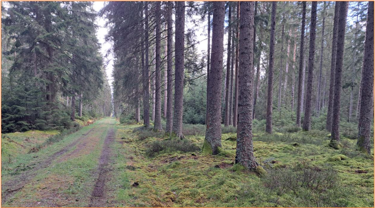
Waldbereich bei Friedenweiler

hat der Dreizehenspecht sein Revier. Und tatsächlich, zuerst nur gehört, dann zeigt sich ein wenig scheues Männchen ausgiebig und in wunderbarer Nahdistanz – einfach klasse!