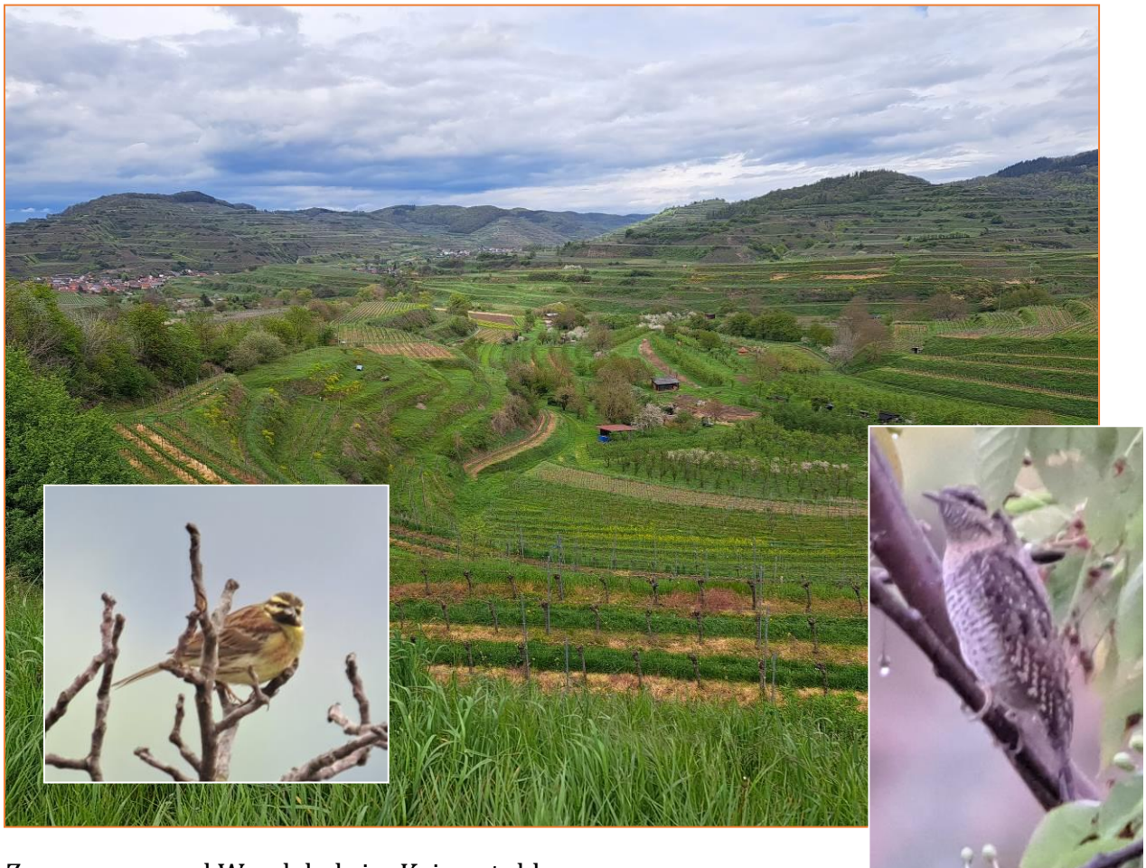
Zaunammer und Wendehals im Kaiserstuhl

Nach der Mittagspause im Rasthaus Lenzenberg wandern wir trockenen Fußes durch das Ellenbuch bei Oberrotweil. Es geht durch einen hochaufragenden Lösshohlweg über das kleine, aber feine Naturschutzgebiet Ebnet zum Schneckenberg. Wendehals ist zu hören, Bienenfresser und Wiedehopf fliegen vorbei und am Wegesrand zeigt sich sogar eine Smaragdeidechse.