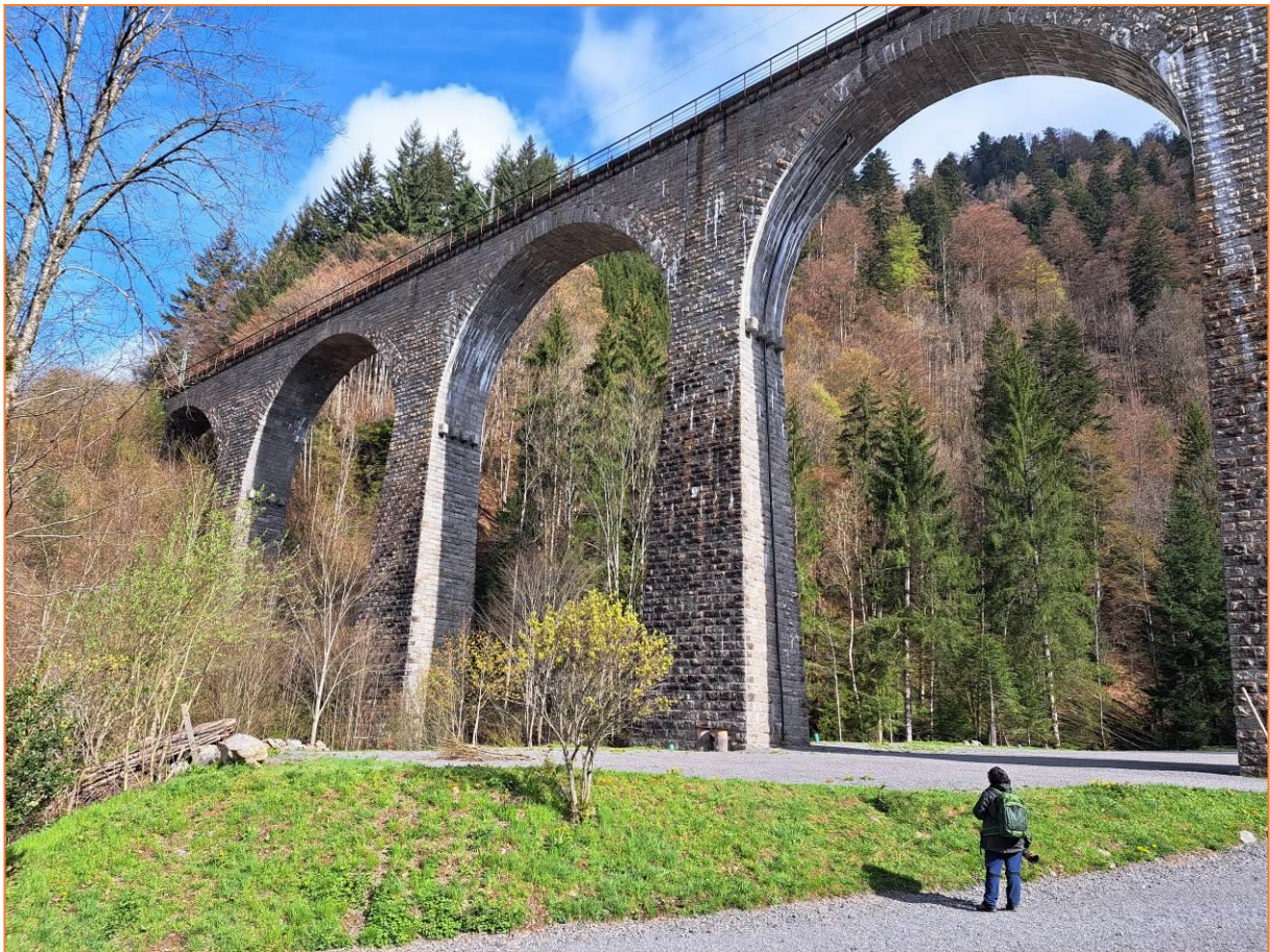
Viadukt in der Ravennaschlucht

Nach einer kleinen Runde im Langenbachtal und einem letzten Frühstück im Hotel Grüner Baum fahren wir zur Ravennaschlucht ins Höllental. Wir besuchen ein beeindruckendes Viadukt, um die dort vorkommenden Felsenschwalben zu sehen. Kaum angekommen fliegen auch schon einige Tiere umher. Anscheinend sind sie gerade mit dem Bau ihrer Nester beschäftigt. Am angrenzenden Bachlauf zeigen sich Wasserramsel und Gebirgsstelze.